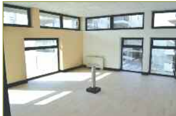
Salle de réunion avec équipement de vidéoprojection