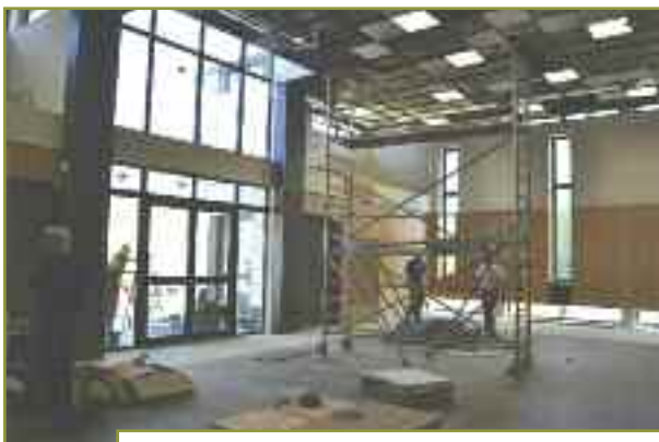
Salle des mariages et du conseil municipal