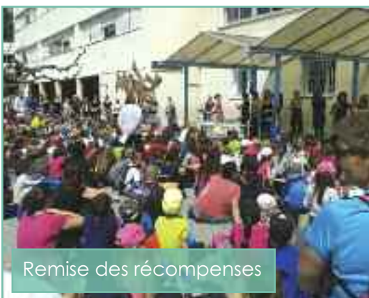
Remise des récompenses