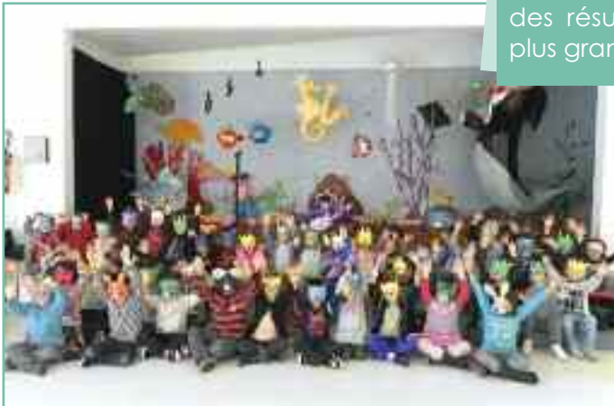
Mises en scène réalisées par les enfants !