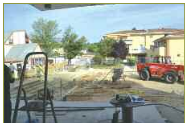
Parvis de la salle des mariages en cours de réalisation

La grande salle du centre administratif sera polyvalente. Elle accueillera les cérémonies et les séances du conseil municipal.