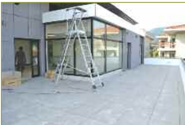
Terrasse située au 2 ème étage