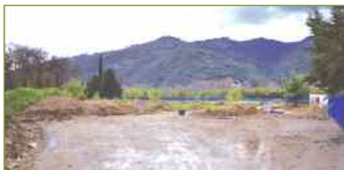
Début des travaux : nettoyage et terrassement