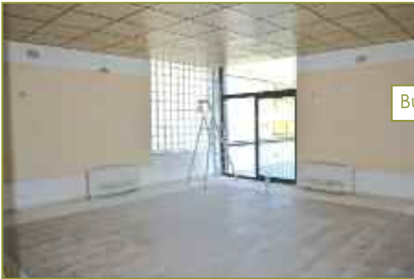
Bureau du maire