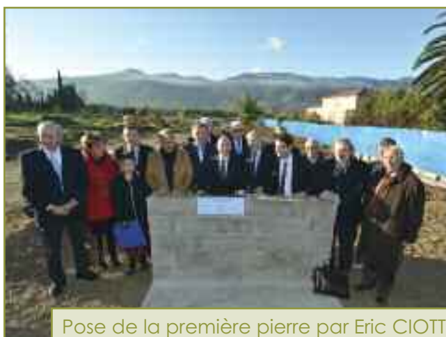
Pose de la première pierre par Eric CIOTTI, président du Conseil Général

Equipements : 3 bassins dont un de nage de 12,5m x 25m et de 5 couloirs, un bassin de loisirs, une pataugeoire et un solarium extérieur de 265m 2 .