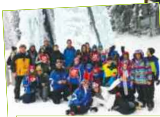
Echappée Blanche dans le Boréon