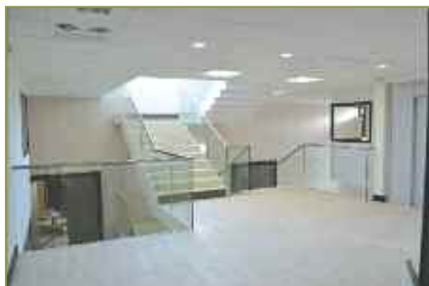
Palier 1 er étage