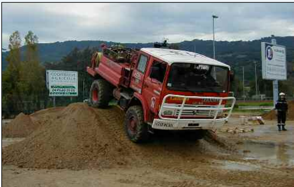
Nous tenons également à souligner et à remercier la participation des pompiers de Pégomas pour leur aide aux sinistrés du 1er novembre dernier, ainsi que leur participation au TELETHON