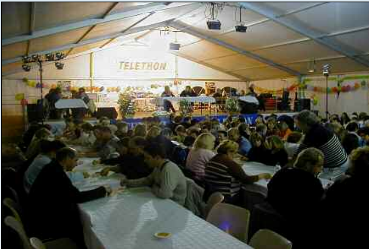
Soirée Loto, organisée par l'association Pégoluthon, qui a rassemblé plus de 250 personnes. Cette année le TELETHON de Pégomas a récolté approximativement 16 000 €.