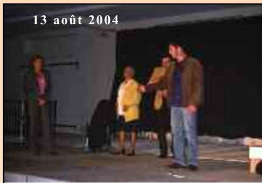
13 août 2004

La Municipalité espère avoir répondu aux attentes de chacun : divertissement et découverte culturelle, à travers un programme varié.