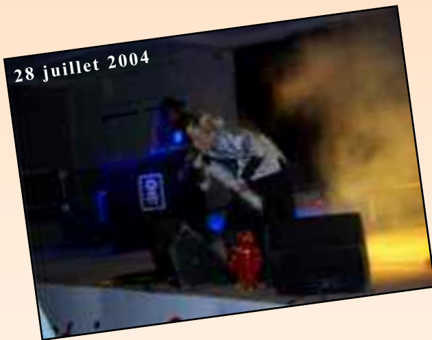
28 juillet 2004