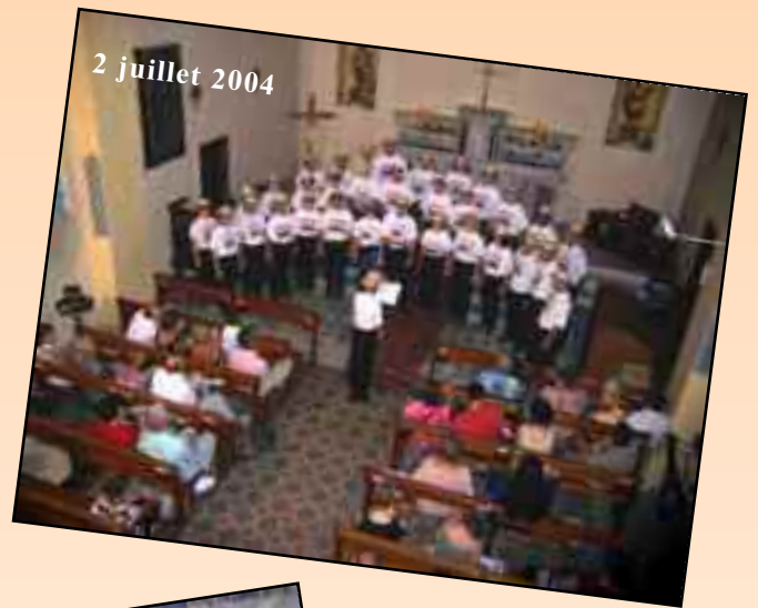
2 juillet 2004