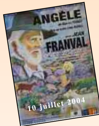
10 juillet 2004