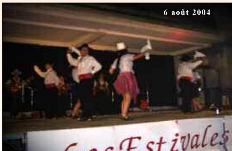
6 août 2004