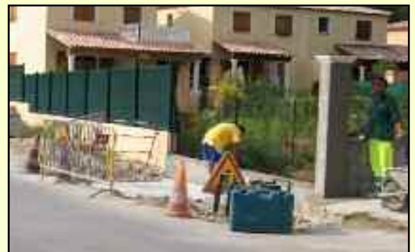
Elargissement du pont sur le Gratte sac, chemin de la Tuillière