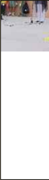
Remise d Mme