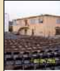
Cinéma en plein air Vendredi 29 juillet - E