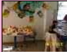
Repas sur le thème des pommes Mois de novembre