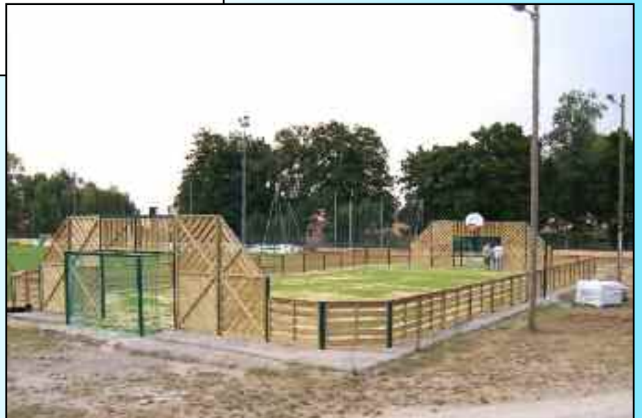
Finition des travaux du microsite, complètement renové au stade Gaston Marchive.