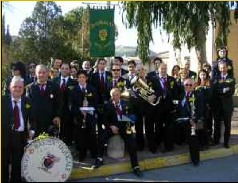
La "BANDA", fanfare de Castel San Niccolò. Corso, Fête du Mimosa 2005