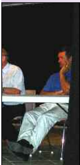
EROY, Président du Mourachonne.