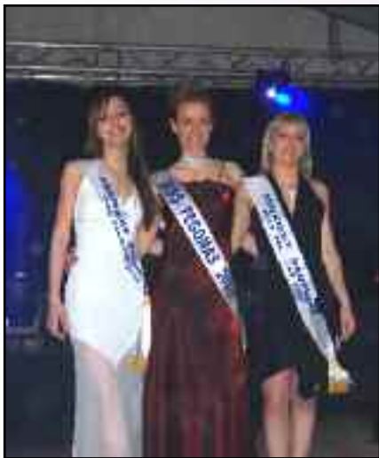
Miss Mimosa 2005 et ses dauphines.