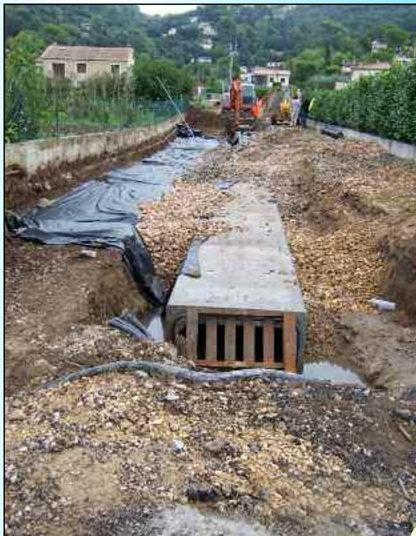
Travaux d'ouverture d'une nouvelle route entre l'avenue Alphonse Daudet et le boulevard des Avelaniers.