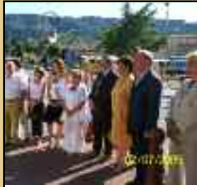
Fête de la Saint Pierre, Dépôt de gerbe Samedi 2 juillet - au Monument aux Morts