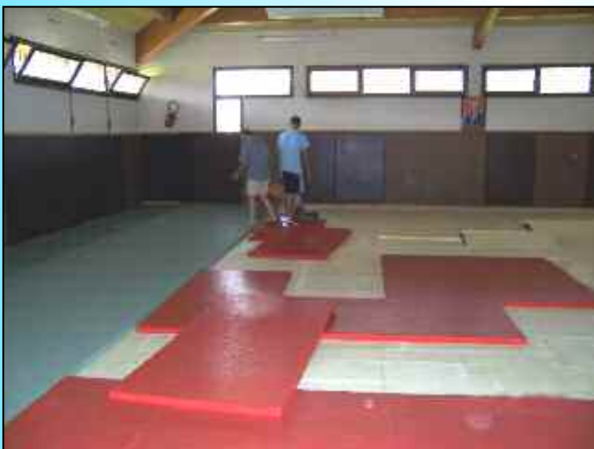
Pose des nouveaux tatamis Salle du Dojo, Stade Gaston Marchive