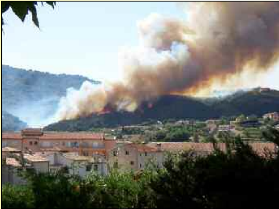
Incendie quartier des Sausserons Mercredi 17 août