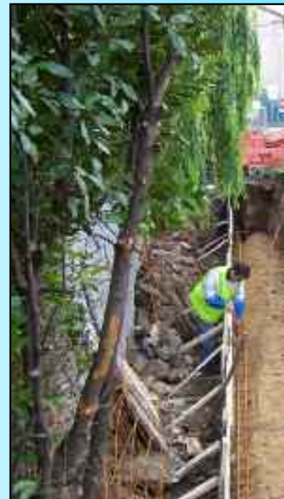
Construction d'un accès Fénerie pour faci