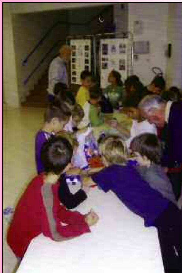
Triage des bouchons par les enfants du C.L.S.H.