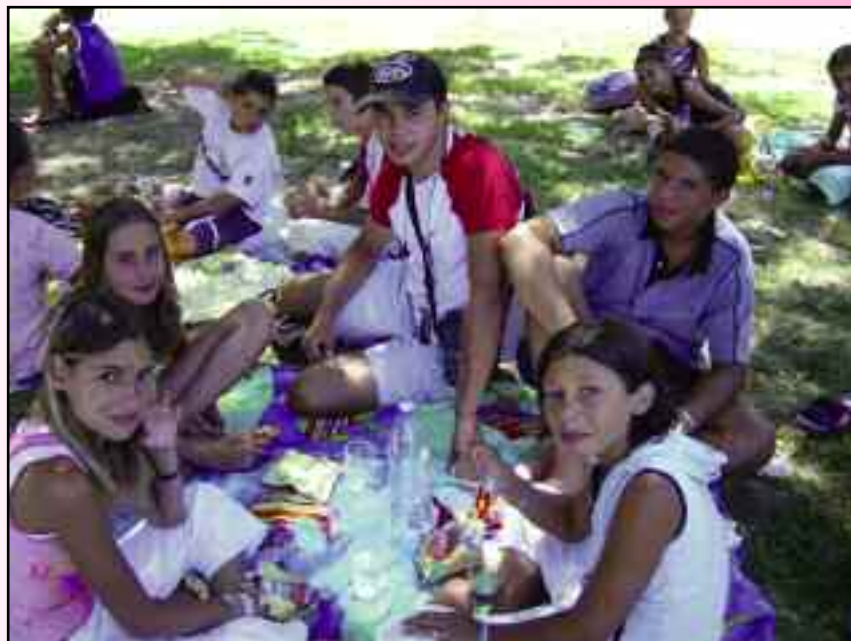
Pique-Nique au Parc Robinson, Eté 2005 - Mandelieu

Séjours, stages, sorties journées (planche à voile, bowling, rencontres inter-centre, tournoi de beach-volley, séjours montagne, séjours kayak...)