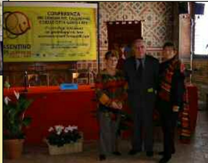
Rencontre européenne pour la participation de notre commune aux Mini-Olympiades 2006, délégation de la Municipalité et du Comité de Jumelage. 27 au 30 octobre, Castel San Niccolò