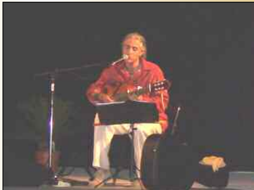
Concert " Chansons Provençales... en Français" Vendredi 19 août - Esplanade de la Salle des Fêtes