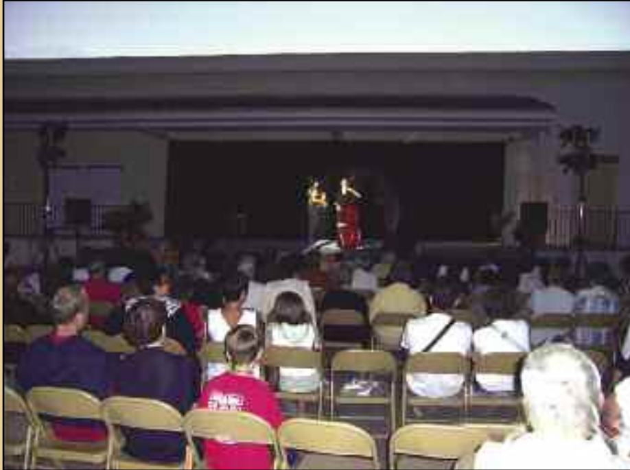
Spectacle "KABARET 31" Vendredi 8 juillet - Esplanade de la Salle des Fêtes