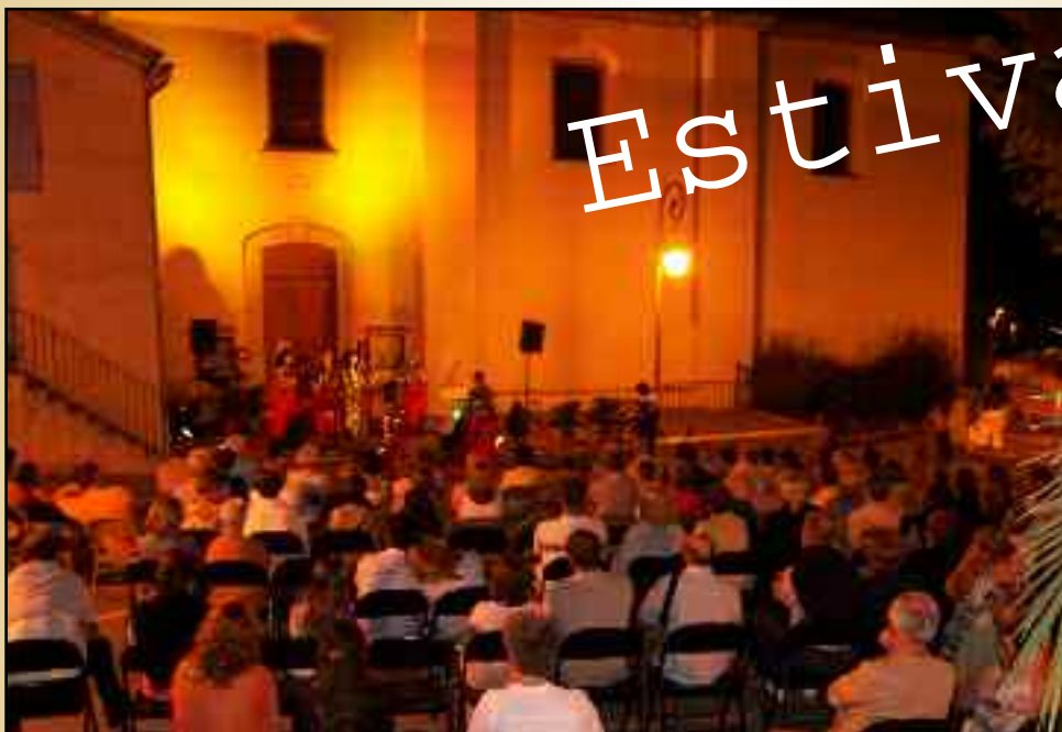
Spectacle "THE BLACKNESS GOSPEL SINGERS" Vendredi 5 août - Parvis de l'Eglise Saint Pierre