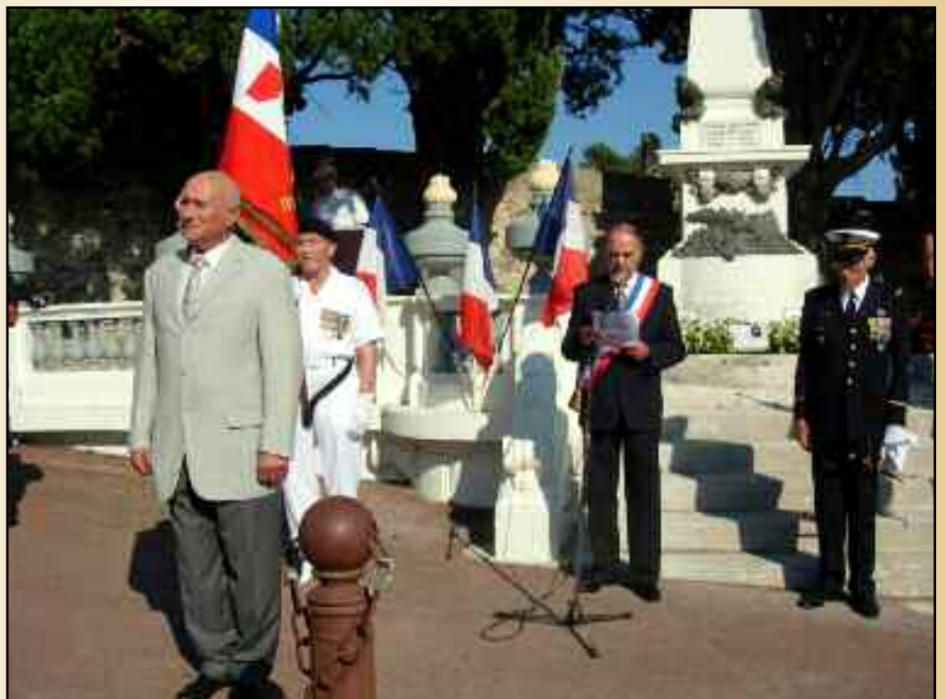
Jeudi 14 juillet - Monument aux Morts