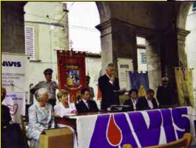
35 ème anniversaire du Don du Sang, délégation de l'association des Donneurs de Sang de la Vallée de la Siagne. 27 et 28 août, Castel San Niccolò