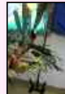
Repas sur le thème du BRESIL Mois de septembre