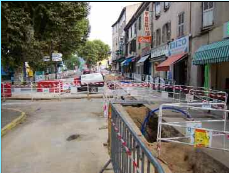
Remplacement de la totalité des canalisations d'eau sur la place du Logis