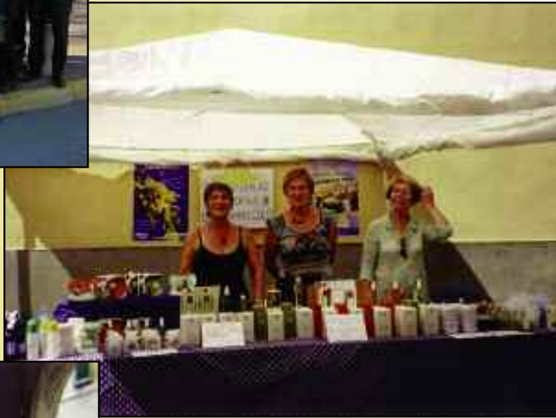
Foire à la bestiane, délégation du Comité de Jumelage avec des produits régionaux. 1 er août, Castel San Niccolò