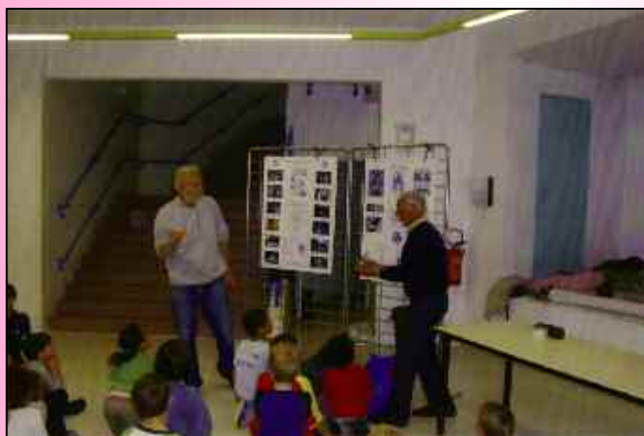
Explications par les bénévoles de l’association.

Objectif : faire participer les enfants à cette opération tout en leur inculquant un geste citoyen = le tri des bouchons .