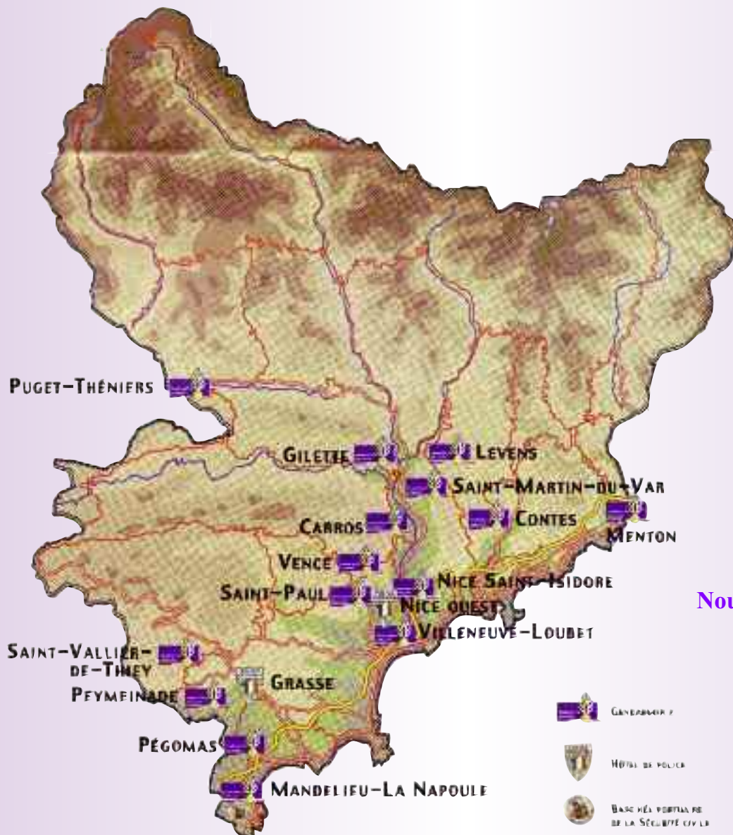
Nouvelle répartition de la sécurité publique des Alpes Maritimes