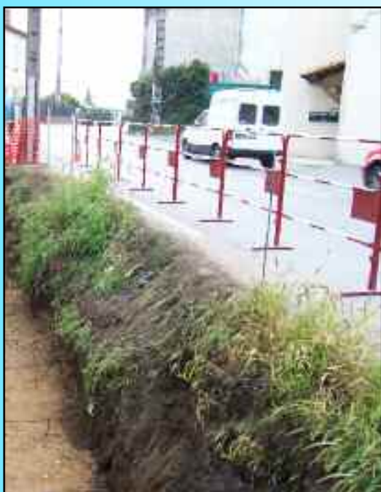
ement et trottoir face au parking litér le passage des écoliers.