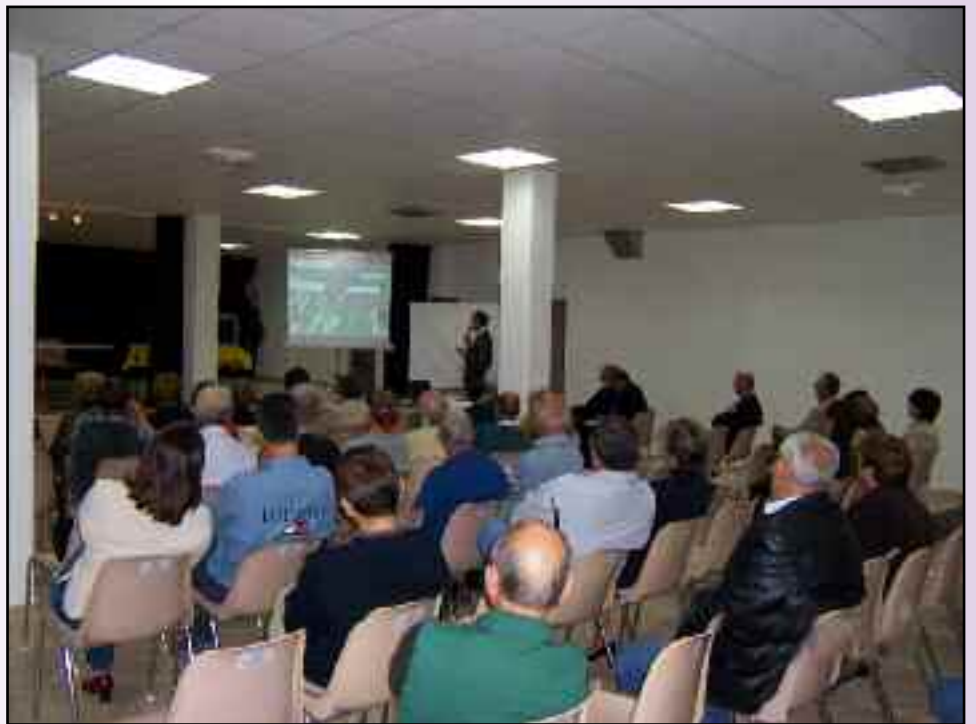
Réunion publique sur les travaux de la Mourachonne, discus- sion sur le pont des Fermes.