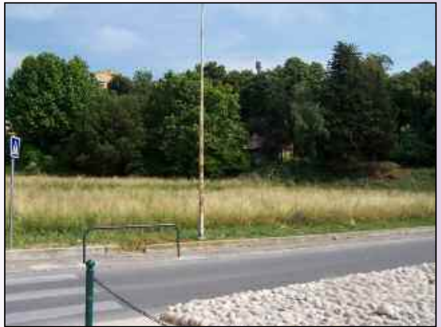
Terrain de la future gendarmerie Avenue de l'Ecluse