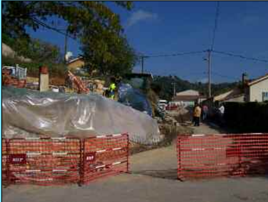
Elargissement de la voie du chemin de la Tuilière.