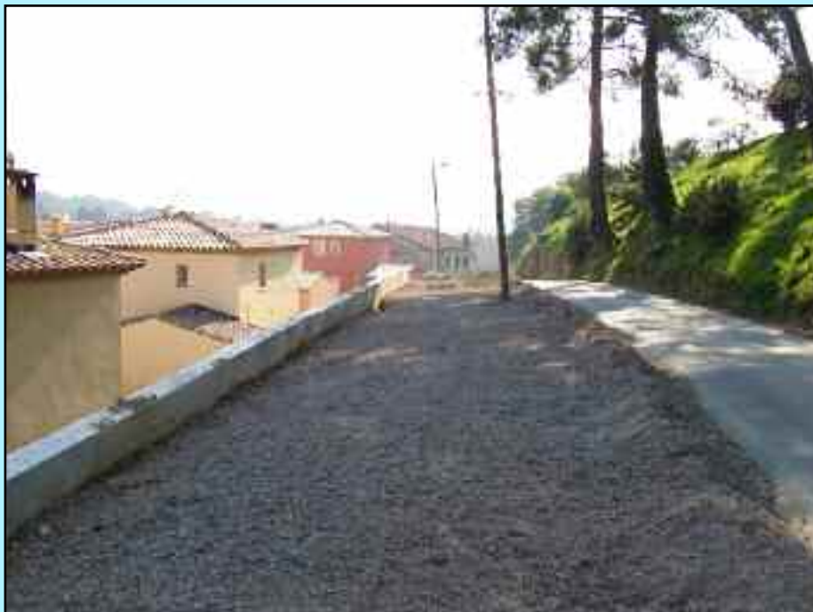
Elargissement chemin des Tapets