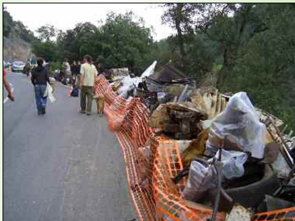
Nettoyage de la Mourachonne et de la Siagne par les jeunes volontaires de l'association "RIKIKIBIANS".

Le 15 octobre, l'association RIKIKIBIANS composée de 200 jeunes étudiants niçois, s'est organisée pour retirer du fond des Gorges de la Mourachonne et des berges de la Siagne, toutes sortes de "monstres" que vous avez peut être aperçus le long de la route avant d'être chargés quelques jours plus tard sur des camions affrétés par le Conseil Régional !