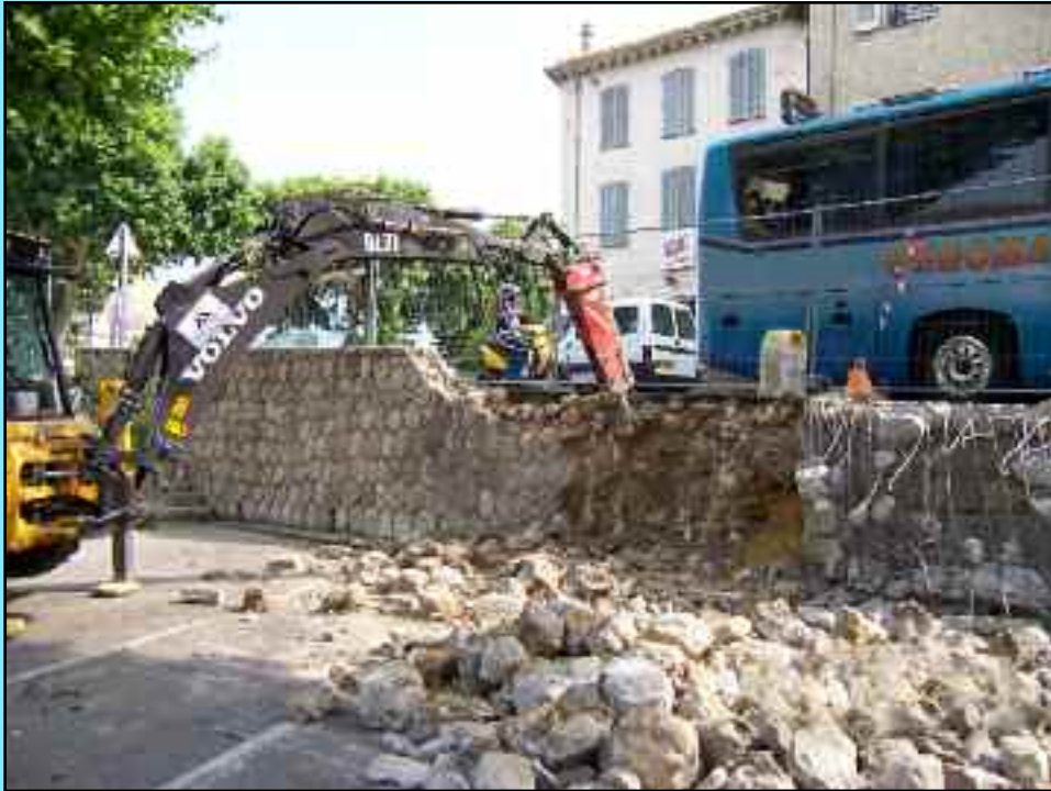
Travaux sur la place du Logis pour l'élargissement des trottoirs.