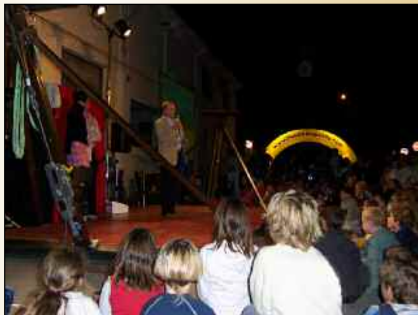
Spectacle " LONELY CIRCUS" Samedi 17 septembre - Esplanade de la Salle des Fêtes