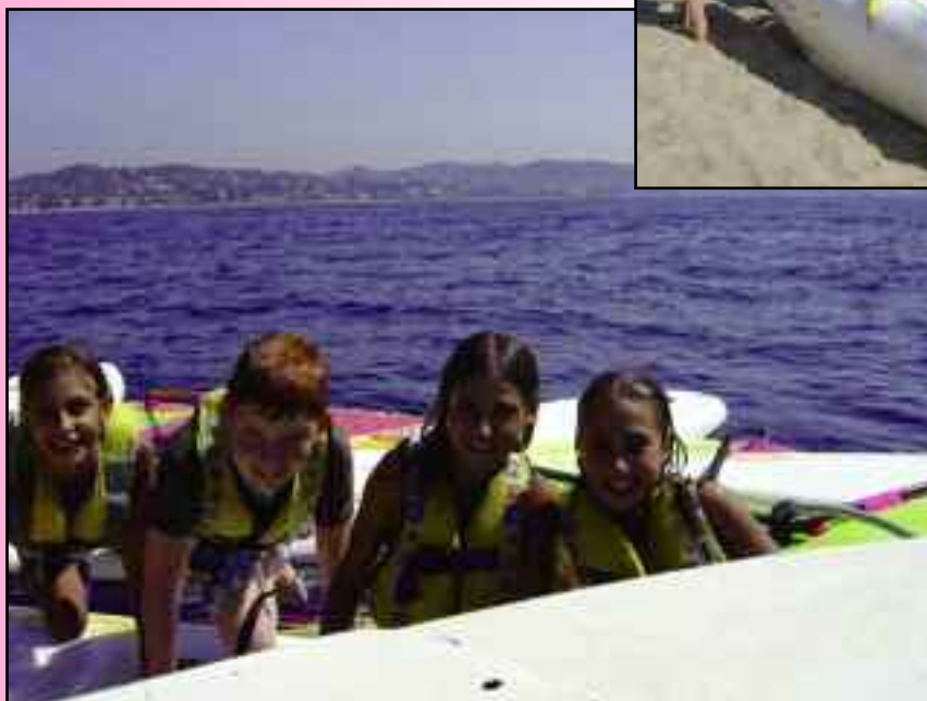
Stage Catamaran / Planche à voile Eté 2005